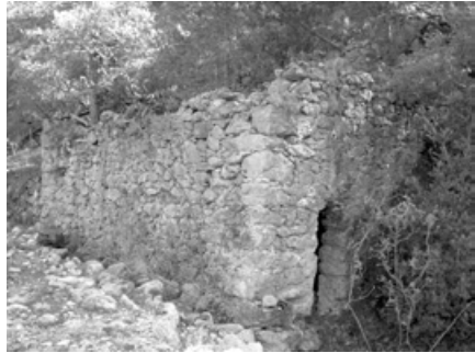
Molí del ciment. 2005.

de 1888, tenia lloc a Tuixent el solemne acte de demarcació de la mina «Vuxadera» i va quedar reduït el seu perímetre a "cuatro pertenencias, cuya superficie horizontal es de cuarenta mil metros cuadrados". L'enginyer va aixecar també un plànol de la mina i va retornar l'expedient a mitjan mes de maig de 1888 en què feia constar la reducció de la cabuda superficial de la mateixa mina "por haber renunciado el interesado en el acto de la demarcación las 8 restantes". El governador va ratificar l'expedient "concediendo á perpetuidad á D. José Mans y Biosca las cuatro