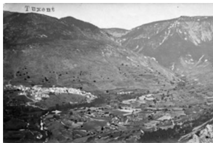
Vista general de Tuixent, 1925

La Ley de Minería de 6 de julio de 1859 establecía que "la propiedad de las substancias [...] inorgánicas, metalíferas, combustibles ó salinas, los fosfatos calizos, la baritina, espato flúor y las piedras preciosas, ya se presenten en filones, ya en capas ó en cualquier otra forma de yacimiento, con tal que exija su disfrute un ordenado laboreo, bien sea éste superficial ó subterráneo [...] corresponde al Estado, y